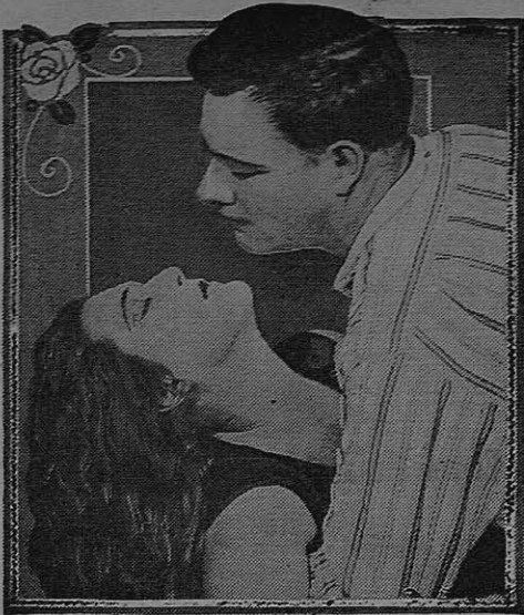
Mary MacLaren IN THE UNIVERSAL SPECIAL ATTRACTION "The Road to Divorce"